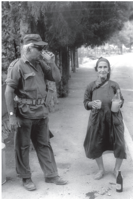
מתנדב במעלות.

על פי נתונים שמסר בן-חור לעיתונות, עד אוגוסט 1969 גויסו ליחידה 1,000 מתנדבים, לפרקי זמן שנעו בין שבוע לשבועיים. כארבעים מהם, וביניהם בן-חור, החלו בפעילותם במועד זה בשלושה יישוביים בגבול לבנון. 104 בתחילת השבוע הוסעו המתנדבים צפונה, אך לעיתים, בשל מחסור בתקציב, הגיעו ליישובים במכוניותיהם הפרטיות. 105 עם הגעתם לצפון, חולקו לחוליות בנות שישה חברים, שבהן נכללה לרוב אישה אחת, ומפקד אחד ששימש בעברו כקצין. לעיתים היה מספר חברי החוליה מועט יותר, בשל מחסור במתנדבים.