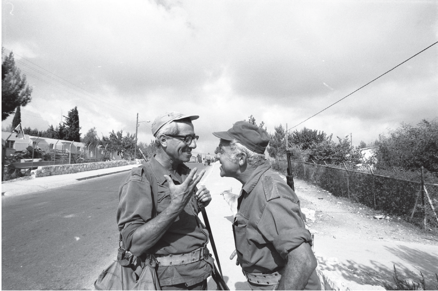
שני מתנדבים במעלות.

בעניין. 67 ייתכן כי רפטור חשש שהמיזם החדש יעיב על "מפעל ההתנדבות לספר" של ההסתדרות, או שהתנגד משום שפעילי הלמ"ס מתחו ביקורת על פעילותו, הממוקדת בקיבוצי הספר בלבד. כך או אחרת, נראה שהתנגדות זו הייתה אף היא בעוכרי הלמ"ס, שכן היא צמצמה את ממדי התמיכה, המועטה ממילא, שלה זכה המיזם.