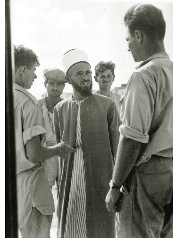
איור 2: ציפורי, 1948.

ביולי 1948 כבשו כוחות צה"ל את הכפר, ותושביו נמלטו ממנו, מחשש מנקמה על התנהלותם כלפי יהודים בתקופת המנדט. 38 מרבית תושביו פנו צפונה, וחצו את הגבול ללבנון וסוריה; 39 מיעוט מהם עברו להתגורר בנצרת ובכפרי הסביבה; וקבוצה שלישית המתינה במקומות מסתור בגליל לשעת כושר שבה יוכלו התושבים לחזור לביתם. בעשור הראשון הייתה תופעת הסתננות הפליטים לתחומי הארץ שכיחה ומוכרת. הם עשו זאת מתוך רצון להתאחד עם בני משפחתם, בשל הקושי להתקיים בחוץ, או מתוך כוונה לפגוע במתיישבים החדשים. 40 אך באזור הגליל הייתה התופעה חמורה במיוחד: "ההסתננות בגליל גוברת" טען שר המשטרה והמיעוטים בכור-שלום