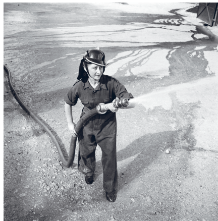
נשים כבאיות בחיפה, 1941.