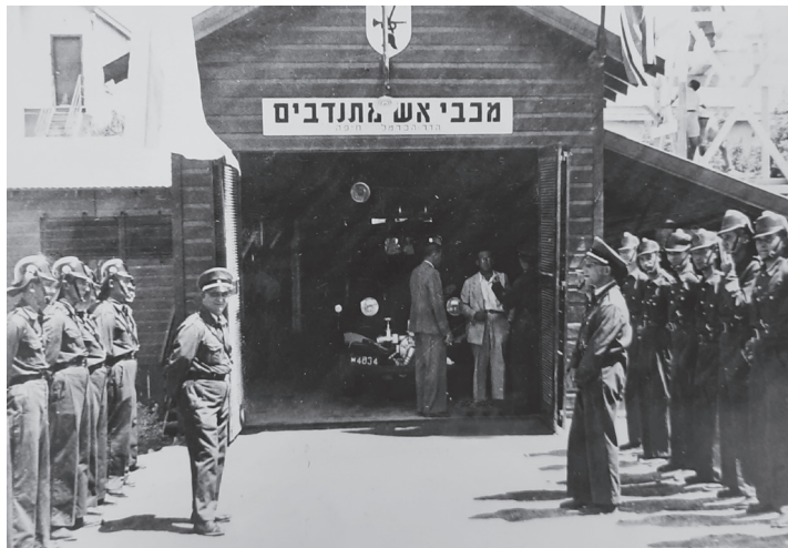
צוות כיבוי אש מתנדבים חיפה.

הצורך בשירותים אלה, כמו גם בהגנה יעילה יותר על ביטחוננו של היישוב מכפי שיכלה לספק לו משטרת המנדט, התחוויר עם פרוץ המרד הערבי באפריל 1936. מרבית השוטרים בתקופה זו היו ערבים, 57 ונאמנותם הלאומית של כלל השוטרים המקומיים, ערבים ויהודים כאחד, עלתה תדיר על נאמנותם למשטרה. 58 עובדה זו הקשתה על משטרת המנדט לתת מענה מתאים בעת התפרצותה של אלימות בין-עדתית, וניסיונות מסוימים שנעשו על ידה עלו בתוהו. 59 לפיכך, ברור היה כי נדרש שינוי בשיטות העבודה ובכוח האדם שלה. בשנת 1937 הורחב גיוס הנוטרים למשטרת המנדט – כוח עזר שגויס מתוך היישוב היהודי, ופעל במקביל גם תחת פיקוד "ההגנה". 60 בשנת 1938 כבר צורפו למשטרת המנדט בכל רחבי פלשתינה למעלה מ-11,000 איש: 7445 שוטרים מיוחדים, 707 שוטרים ללא תקנים קבועים, ו-3608 שוטרים מוספים. 61