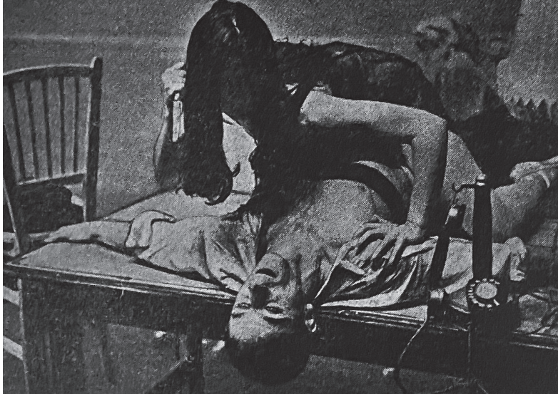
תמונה 3: הרוצחת המפתה מכניעה את הבלש. צלם לא ידוע 9-9-9, 42, 2 (1956).

על מאהבה הרוצח, ומעוררת את חשדם של הבלשים, שכן היא מאופרת היטב ושערה מעוצב, בשונה מן הדימוי המגדרי המקובל של האישה האבלה. 83