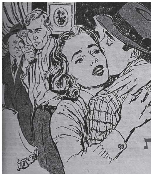
תמונה 5: "איר ללא שם" 9-9-9, 25, 42 (1955).