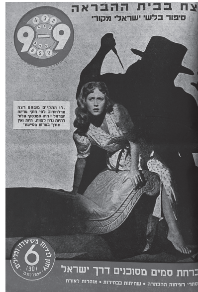
תמונה 1: שער הגיליון, 9-9-9, 30 (1955).