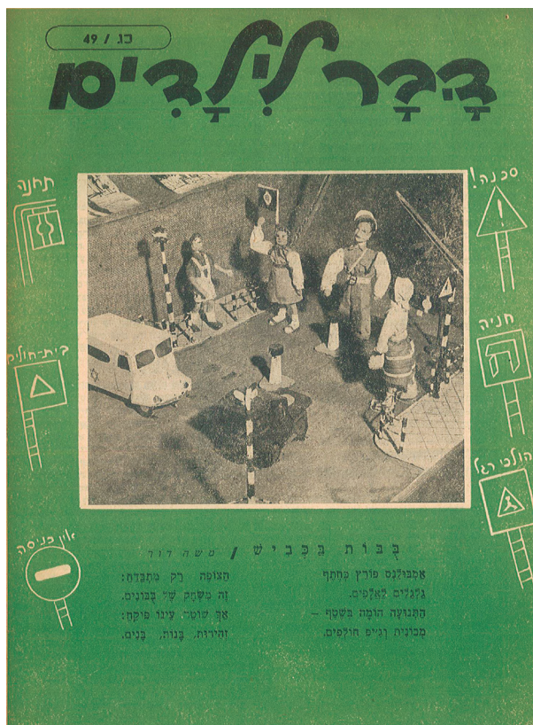
בובות בכביש, ביניהן שוטר הפוקח עין על הנעשה במרחב, שער דבר לילדים כג(49), 19.8.1953